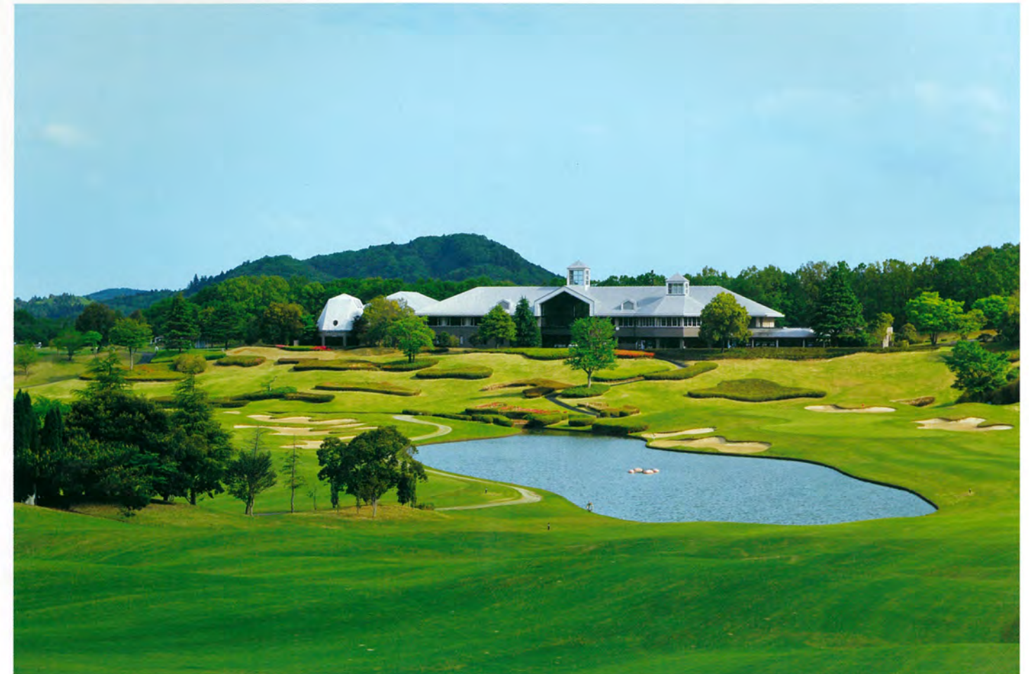
9番ホールよりクラブハウス全景を望む