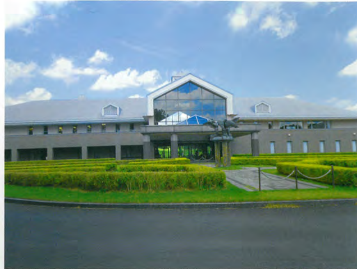
クラブハウス正面