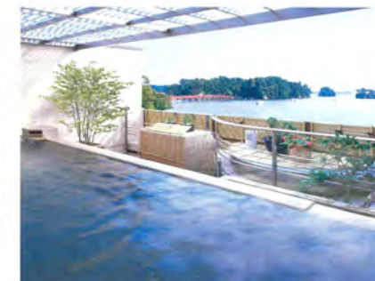
松島湾ビューの露天風呂