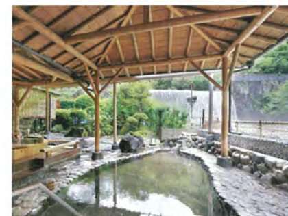
滝が見える露天風呂