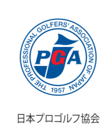
日本プロゴルフ協会