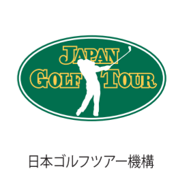
日本ゴルフツアー機構