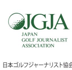
日本ゴルフジャーナリスト協会