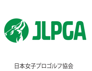
日本女子プロゴルフ協会